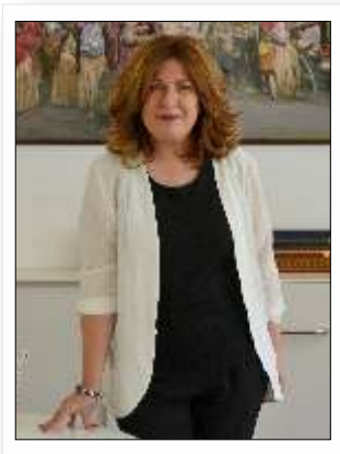
Natalia de Andrés Alcaldesa de Alcorcón

El verano ya está aquí para traer una intensa programación estival con alternativas culturales y de ocio para todos los gustos y edades. Actividades y campus deportivos, cine de verano, teatro para toda la familia, música en los templetos, baile, campamentos... A partir del mes de junio, nuestra ciudad acoge una completa programación porque, incluso en vacaciones, la vida y participación vecinal está más activa que nunca.